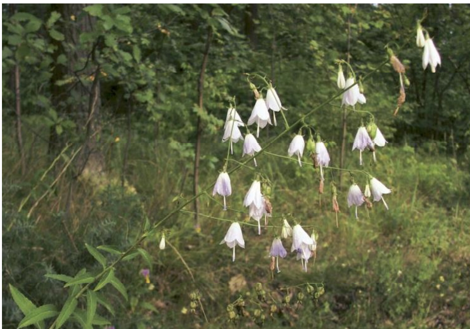
Fot. 1. Dzwonecznik wonny Adenophora liliifolia w ostoi siedliskowej „Dąbrowa koło Zaklikowa”.