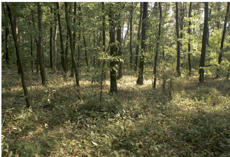
Fot. 2. Świetlista dąbrowa w ostoi siedliskowej „Wierchowiska”.

W trakcie kwitnienia nie jest możliwa pomyłka z innymi gatunkami, natomiast w stanie płonnym, zwłaszcza młode osobniki można ew. pomylić z niektórymi dzwonekami.