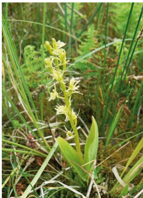
Fot. 1. Lipiennik Loesela