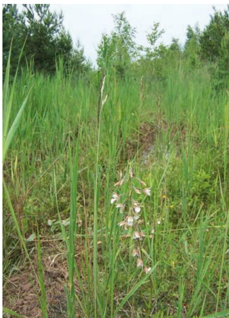
Fot. 2. Siedlisko lipiennika z gatunkami mu towarzyszącymi – Bagna k. Antoniowa