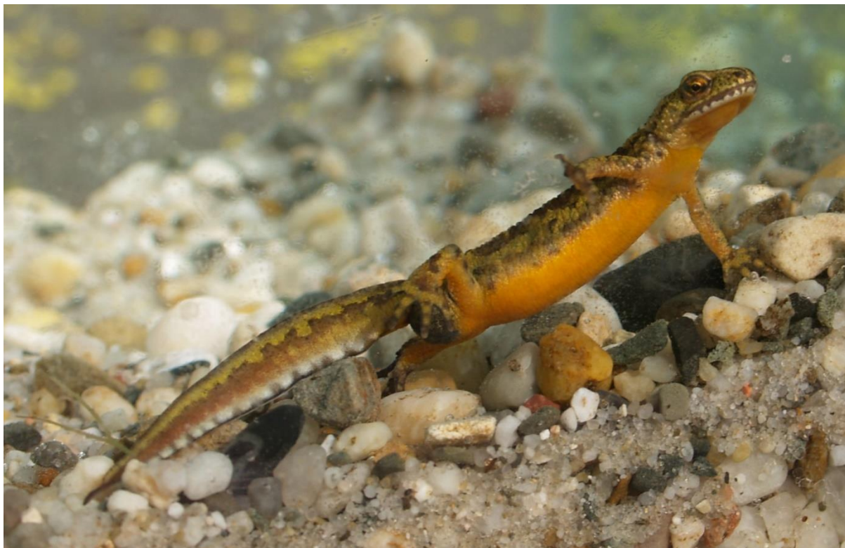
traszka karpacka Triturus montandoni