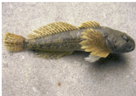
Fot. 2. Głowacz białopłetwy – strona boczna.

Głowacz białopłetwy to gatunek o krótkim okresie życia, w warunkach naturalnych trującym zwykle 4–5 lat. Osiąga dojrzałość płciową w drugim lub trzecim roku życia. Do