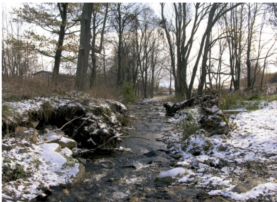
Fot. 4, 5, 6. Typowe, rzeczne siedliska gatunku.

słoneczne (Gaudin, Caillere 1990). Zwykle występuje w płytkich strefach rzeki na głębokości 15–50 cm. W zależności od wieku preferuje zmienną średnicę cząstek stanowiących substrat denny: osobniki o długości ciała 2,5–3 cm najczęściej występują na żwirze (średnica cząstek wynosi 2–3 cm), osobniki sześciocentymetrowe wybierają grubszy żwir o średnicy 6–8 cm, a ryby najstarsze (powyżej 10 cm) – kamienie przekraczające 15 cm średnicy (Bless 1982). W ciekach o piaszczystym podłożu wybiera siedliska pokryte rumoszem drzewnym (niepublikowane dane własne). Nie jest wyraźnie związany z żadnym z typów siedlisk przyrodniczych opisanych w Załączniku I Dyrektywy Siedliskowej, a jedynym, w którym można się go spodziewać jest 3260 – nizinne i podgórskie rzeki ze zbiorowiskami włosieniczników Ranunculion fluitantis .