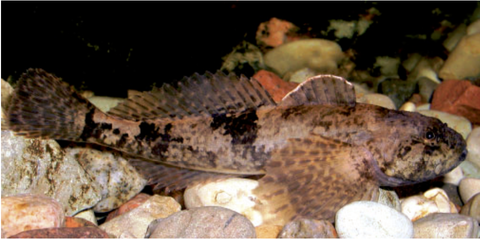
Fot. 1. Głowacz białopłetwy Cottus gobio.