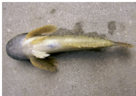
Fot. 3. Głowacz białopłetwy – strona brzuszna.