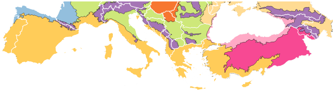
Rysunek 2. Mapa regionów biogeograficznych